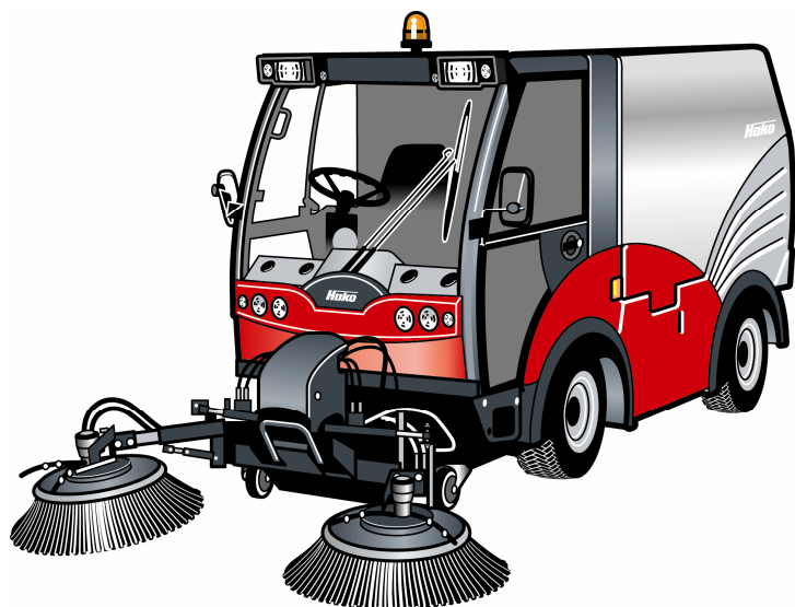
Hako Citymaster 2000

Soluzione professionale per utilizzi municipali in tutte le stagioni, la Hako Citymaster 2000 stabilisce nuovi standard in termini di utilizzo e confort per l'operatore.