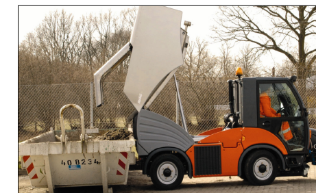
Scarico in quota fino a 140 cm, inclinazione 45°