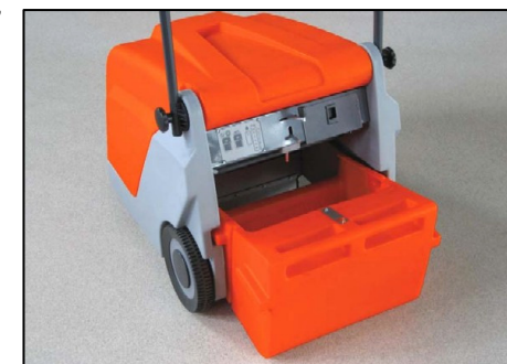
Cassetto di raccolta facilmente accessibile

La più piccola spazzatrice della linea Hamster è pronta all'uso in ogni situazione.