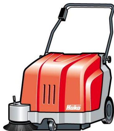
Hako-Hamster 500 E

Capacità di pulizia: fino a 2.400 m 2 /h