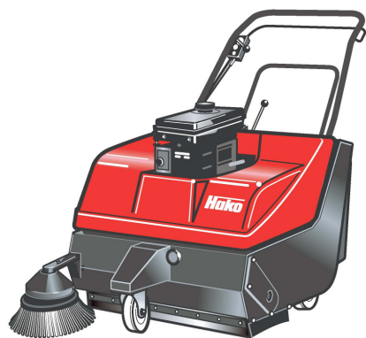
Hako-Hamster 780 V

Capacità di pulizia: fino a 3.400 m 2 /h