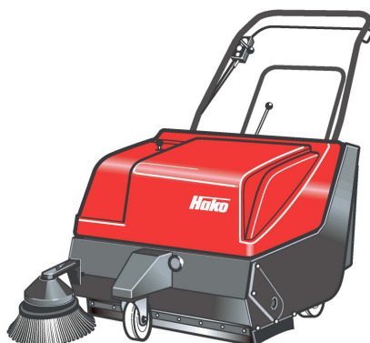
Hako-Hamster 780 E

Come gli altri due modelli più piccoli della linea Hamster, la Hako Hamster 780 è progettata sia per utilizzi in ambienti chiusi, con il modello a batteria, sia per utilizzi all'aperto, con la versione a benzina.