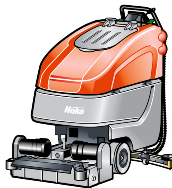
Hakomatic B 90 CL