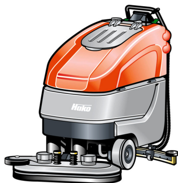
Hakomatic B 90

La macchina perfetta per il lavaggio di medie e grandi superfici. Ottimo risultato, notevole manovrabilità, alta facilità di utilizzo e numerose opzioni incrementano la produttività e l'ergonomia.