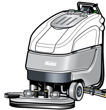
Hakomatic B 90 CL H